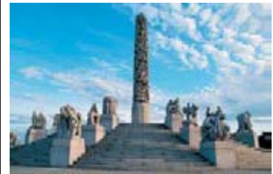
Парк Вигеланна занимает 80 акров. В нём 212 скульптур. Их макеты были выполнены в натуральную величину Густавом Вигеланном. Он также является автором архитектурного и ландшафтного проекта.

Как и многие столицы, исторически Осло был разделён на две части: Весткант, где жили состоятельные люди, и Эсткант, где жили рабочие. Отголосок этого разделения прослеживается и в литературе. Среди летописцев, годами фиксировавших историю нарождающегося рабочего движения на рубеже веков, был писатель Оскар Бротен. От центра конференции ИФЛА-2005 вдоль реки Акер ведёт тропинка по тем местам, о которых повествовал Оскар Бротен, мимо маленьких, старинных деревянных домиков, где жили рабочие, мимо кварталов социального жилья, застроенных в 1930-х годах, и старых мануфактур, расположенных у водопадов. Река Акер, протекающая через центр города, до сих пор настолько чиста, что в ней можно даже ловить форель.