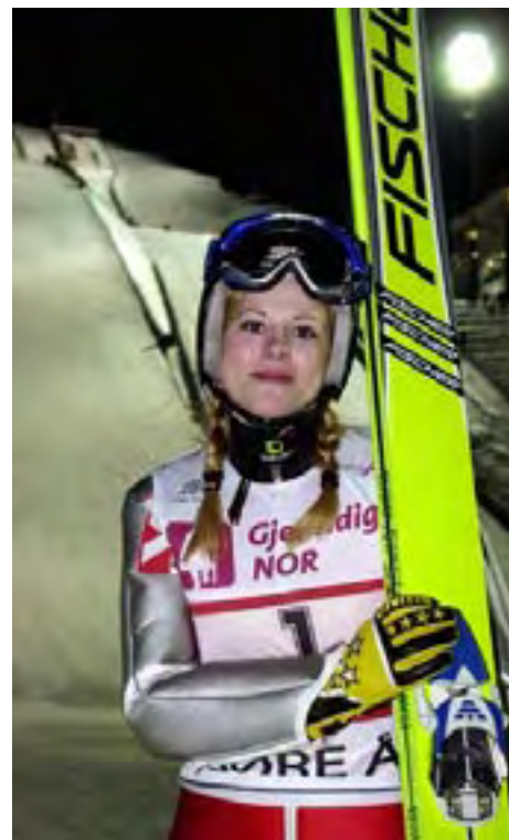
Igualdad de Género: Anette Sagen, saltadora de esquí.

En 1947, Thor Heyerdahl partió en su expedición a través del Océano Pacífico navegando en una balsa de madera. Su propósito era probar que la Polinesia podría haber sido poblada por colonos de América del Sur. En el año del centenario de noruega, la expedición Tangaroa partirá tras la estela de Thor Heyerdahl. Esta vez, el objetivo será comprobar el estado del entorno oceánico internacional. Al igual que en 1947, la tripulación estará formada por cinco noruegos, un sueco y un loro. La balsa original Kon-Tiki está expuesta en el Museo Kon-Tiki de Bygdøy, Oslo. En Bygdøy también se puede encontrar el Museo Fram, que alberga el famoso barco Polar usado por Fridtjof Nansen y Roald Amundsen, que fue la primera persona en llegar al Polo Sur. Nansen no es sólo famoso por ser explorador polar y científico, sino también por su trabajo social en Rusia en los años 20 y como fundador de la Liga de Naciones después de la Primera Guerra Mundial.