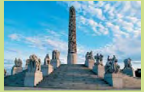
El Parque Vigeland ocupa una superficie de 32.000 metros cuadrados. Las 212 esculturas fueron realizadas a tamaño normal por Gustav Vigeland, quien también diseñó el entorno arquitectónico y los jardines

Las grandes tiendas de cadenas internacionales se encuentran en el centro de la ciudad alrededor de la parte peatonal de Karl Johans Gate. Hay grandes almacenes dentro y alrededor de la zona comercial "Oslo City". En la zona del puerto, en el lugar de un antiguo astillero, Aker Brygge ofrece una gran variedad de tiendas y cafeterías con y sin terraza. Para encontrar los jóvenes diseñadores noruegos, hay que ir a Grünerlokka, donde pequeñas tiendas independientes venden ropa, cerámica, arte y otros artículos. Aquí también hay tiendas de cadenas internacionales. A todas estas tiendas se puede llegar a pie desde el centro de la ciudad.