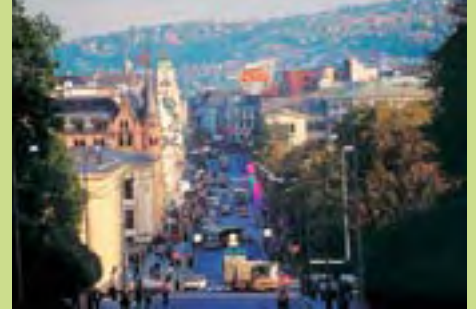
Karl Johans Gate.