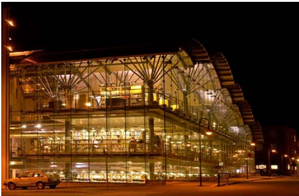
Bibliothèque Tønsberg.