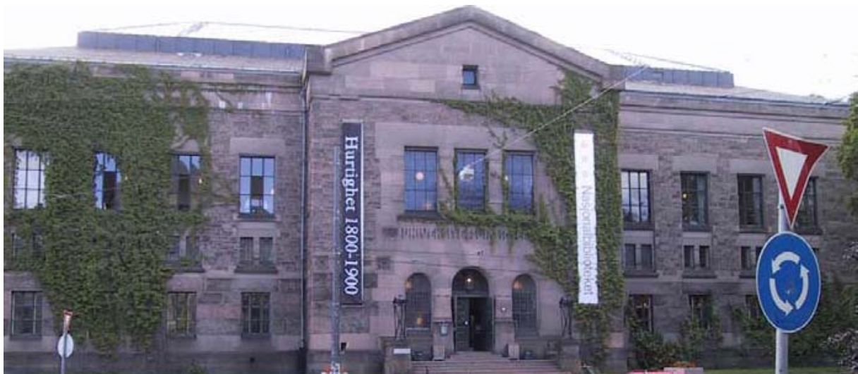
La bibliothèque nationale à Oslo.

L'ouverture d'une bibliothèque nationale virtuelle de Norvège sur l'Internet est un autre volet de la stratégie visant à mieux faire connaître la collection et à toucher un public plus large.