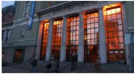
Bibliothèque publique d'Oslo