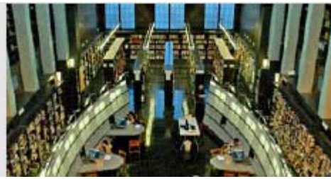
Bibliothèque publique d'Oslo