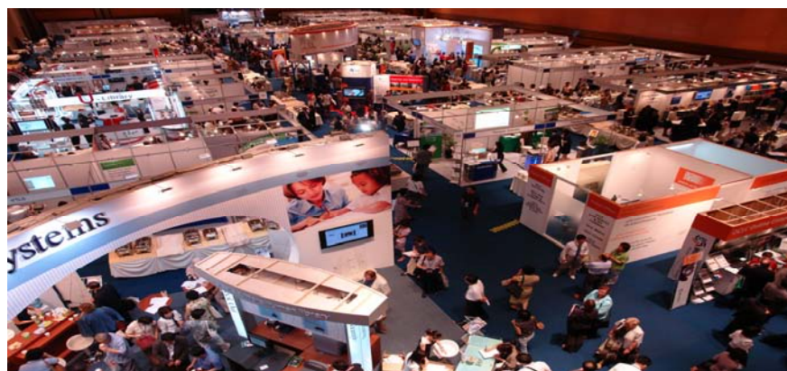
- Exposición -

Desde 2002, el Premio de Acceso al Aprendizaje ha sido gestionado por el Consejo sobre Recursos Bibliotecarios y de Información. A partir de 2007, la Red Internacional para la Disponibilidad de Publicaciones Científicas (INASP) comenzará a gestionar el premio.