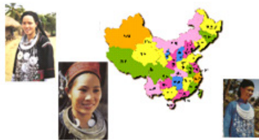
Li Ethnic Minority Group

«Ли»- коренные жители острова Хайнань на юге Китая. Их язык существует только в устной форме и не имеет письменных источников. Представители народности отличались своеобразием интеллекта, для счета, к примеру они плели узелки на верёвках и использовали бобы