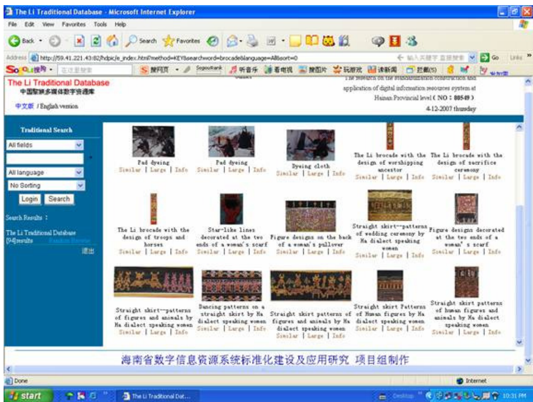
Пример результатов поиска (английская версия).