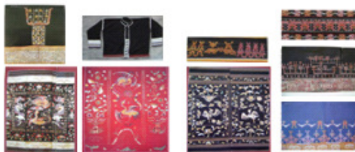
Li hand-made brocade: costumes and bedcover

Народность обладает навыками древнейшей ткацкой технологии. В пятом веке технология ручного текстиля, получившая свою известность во времена правления династии Сонг (1000 лет тому назад), достигла высокого уровня. В начале эпохи правления династии Ыанг (1271-1368), легендарный ткач в Китайской истории, сумел изучить передовые