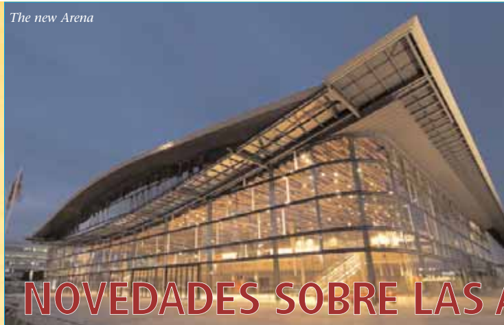
The new Arena

CONGRESO MUNDIAL DE BIBLIOTECAS E INFORMACIÓN ▶ 73 Congreso General y Consejo de la IFLA ▶ Sudáfrica, 19-23 de agosto de 2007