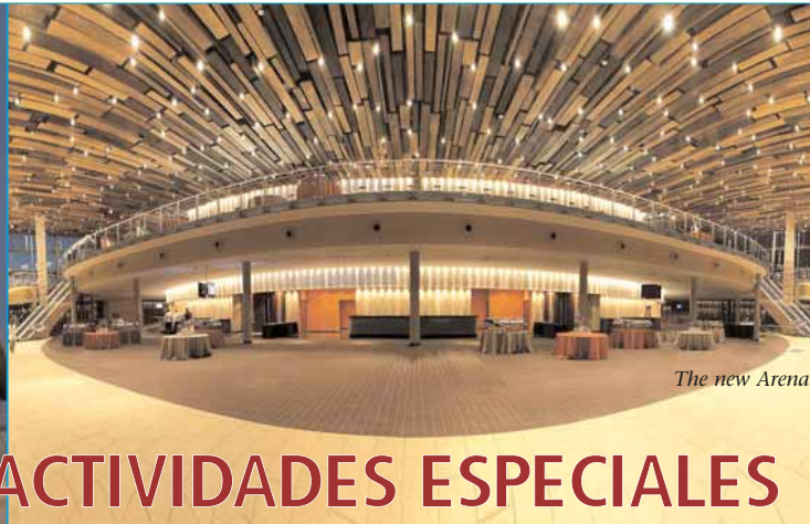
The new Arena