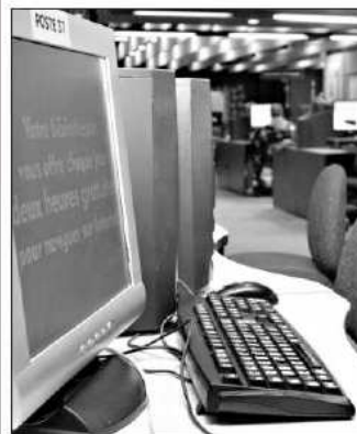
L'ordinateur et les technologies numériques sont au cœur de l'évolution des bibliothèques.

Les bibliothèques sont d'ailleurs plus populaires que jamais. «C'est l'équipement qui se