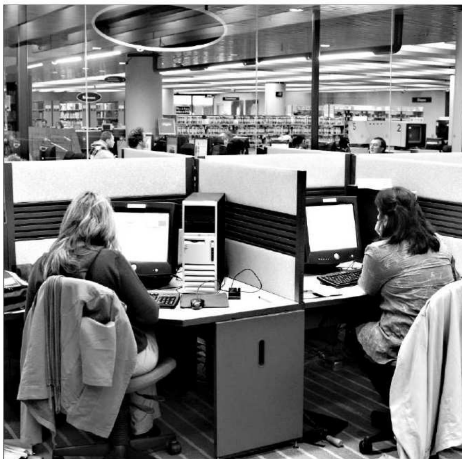
Lieux de savoir et de culture, les bibliothèques sont là pour rester, assurent les spécialistes.

construit le plus dans le monde aujourd'hui, affirme la pdg de BANQ. Il n'y a plus de lieu de rassemblement gratuit et accessible à tout le monde. Autrefois, c'était l'église ou le magasin général. Maintenant, ce sont les bibliothèques qui deviennent le lieu citoyen par excellence. Puisque les gens sont de plus en plus scolarisés, ils ont envie de fréquenter ces lieux de savoir et de culture. On observe le même phénomène partout.