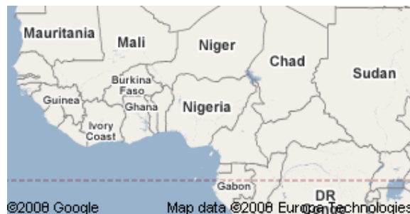
Afrique de l'Ouest

L'Afrique de l'Ouest est située le plus à l'Ouest du continent africain . Géopolitiquement, l'Afrique de l'Ouest se compose des 16 pays suivants sur une superficie approximative de 5 millions de km 2 :