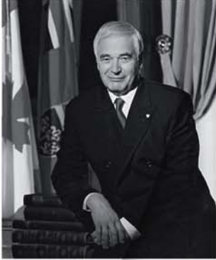
معالي السيد جيمس ك. بارتلمان اليوم الأربعاء 13 أغسطس 2008 في تمام الساعة 12,45 بالقاعة رقم 2000BC

أنهى معالي الحاكم جيمس ك. بارتلمان فترة ولايته ككاتب رقم 27 محافظ إقليم أونتاريو في الخامس من سبتمبر عام 2007. وقد ركز خلال فترة ولايته على ثلاث أولويات: محو الصورة السلبية للأمراض العقلية، تأييد الجهود المناهضة للعنصرية وتشجيع شباب السكان الأصليين لكندا.