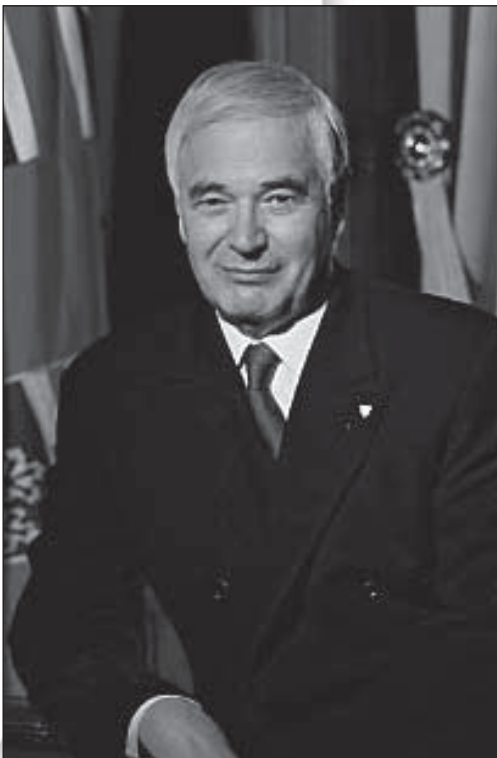
L'Honorable James K. Bartleman

Aujourd'hui, 13 août 2008 à 12 h 45 Salle 2000bc