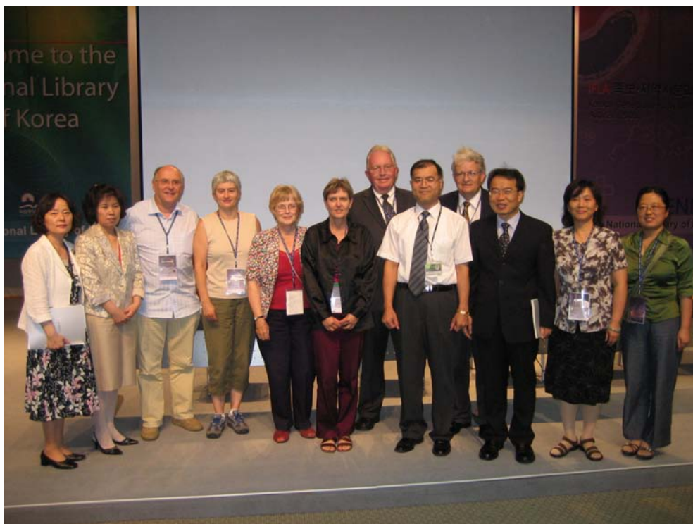
- Miembros del Comité Permanente -

“La Genealogía Coreana: una Tradición Dinámica”, un taller de trabajo organizado el 21 de agosto por la Biblioteca Nacional de Corea para la Sección de Genealogía e Historia Local en la Biblioteca Nacional atrajo a 80 participantes internacionales y de Corea.