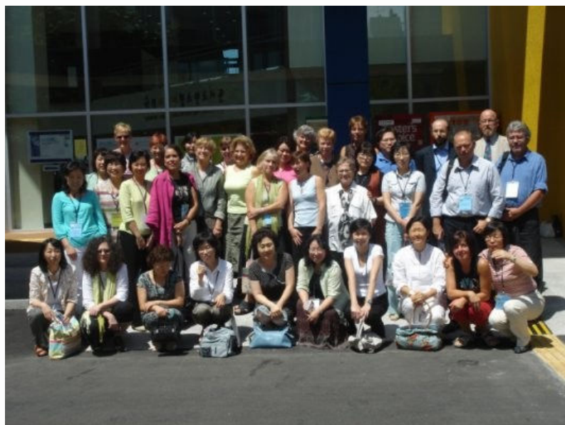
Participantes de la reunión satélite de la Sección de Adquisiciones. 16-18 de agosto, Biblioteca Nacional para Niños y Adolescentes.

La Sección de Adquisiciones y Desarrollo de la Colección, fundada en 1976, celebra su 30º Aniversario con la organización, junto con la Sección de Publicaciones Seriadas y Otros Recursos Continuos, de un programa abierto en la sala 105 con el título “Desarrollo de modelos comerciales para colecciones híbridas”.