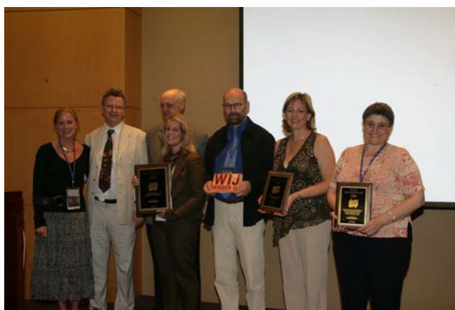
- 4º Premio Internacional de Marketing de la IFLA -

En el número 6 de IFLA Express (miércoles 23 de agosto de 2006) se publicó un pie de foto incorrecto para esta imagen. Nuestras más sinceras disculpas a todos los participantes, incluido, por supuesto, el patrocinador SirsiDynix. La descripción correcta es la que aparece a continuación.