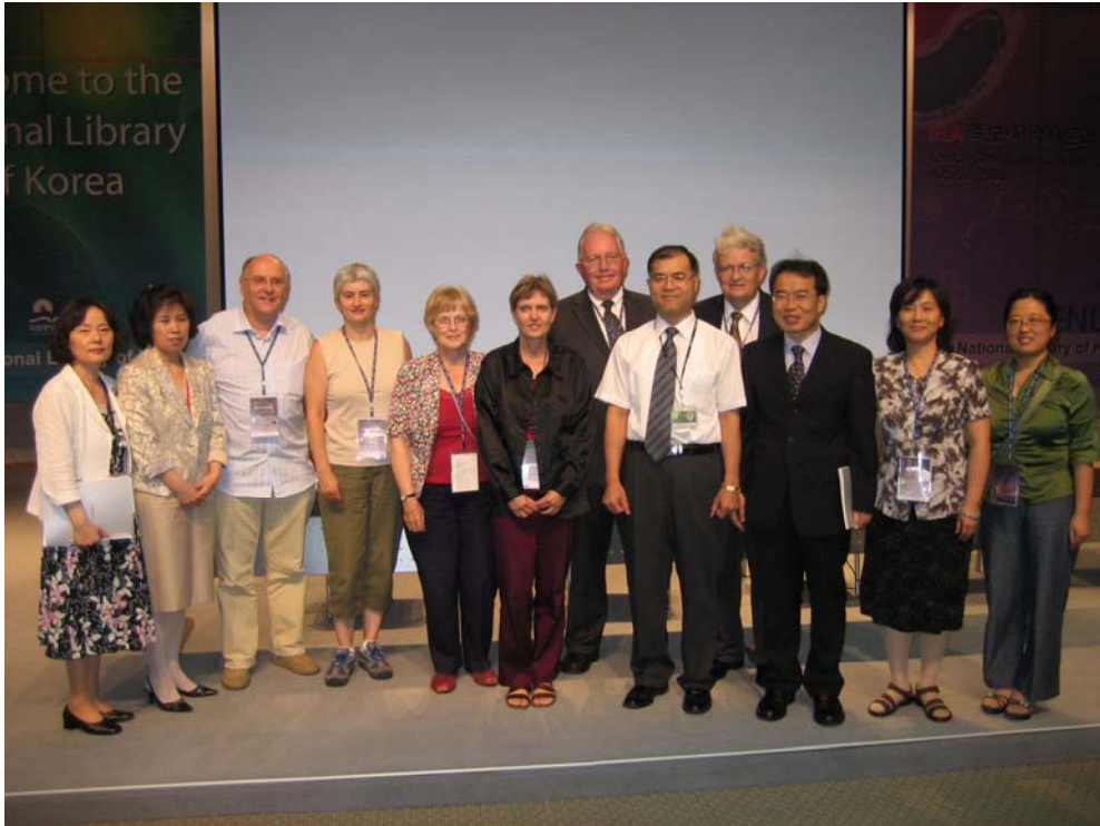
- 常设委员会与发言人 -

“韩国家谱：动态的传统”——韩国国家图书馆为家谱与地方志专业组举办的讨论会吸引了 80 名来自韩国和国际参会者。