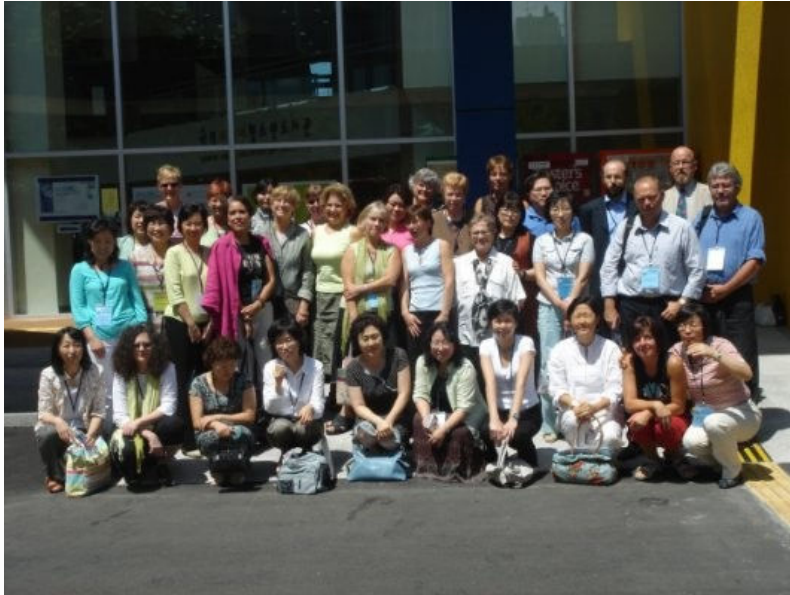
采访专业组卫星会议参会者，8 月 16—18 日于国家儿童与青少年图书馆

采访与馆藏建设组在 105 房间举行了成立 30 周年纪念仪式，同连续出版物与其他连续性资源组合作安排了一个开放式活动，题为“发展中的复合馆藏商业模式”。该专业组于 1976 年成立。